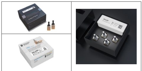
по 1 шт. в упаковке

2.1. Материал стоматологический CELTRA DUO на основе силиката лития, усиленного оксидом циркония (ZLS), в блоках для изготовления стеклокерамических реставраций (1 или 4 шт/уп)