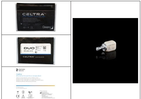
* - различие только в макете упаковки и количестве блоков в упаковке